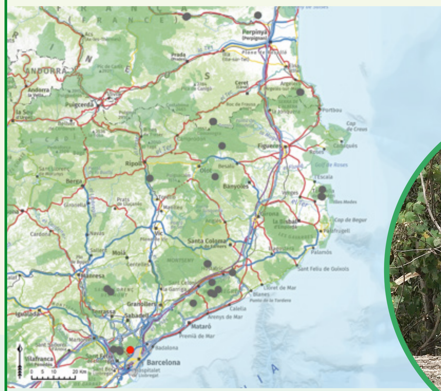
Localització del rodal demostratiu "Font Graga" (vermell) i de la resta de rodals del projecte (gris) dins de la Xarxa Natura 2000.