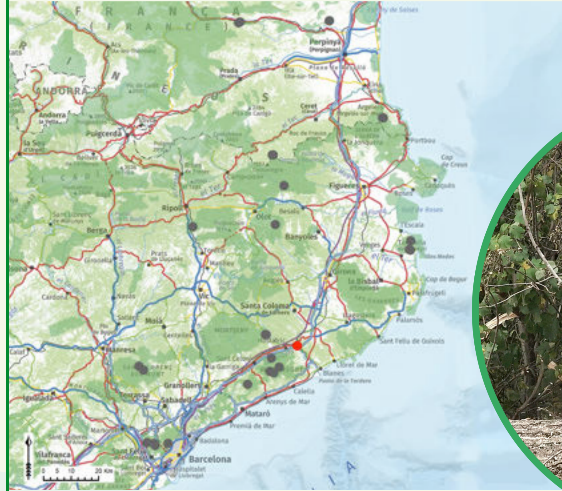
Localisation du peuplement de démonstration "Can Buscatell" (rouge) et du reste des peuplements du projet (gris) dans le réseau Natura 2000.