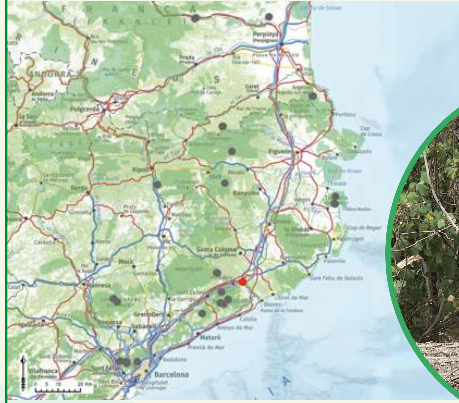
Localización del rodal demostrativo "Cam Buscatell" (rojo) i del resto de rodales del proyecto (gris) dentro de la Red Natura 2000.