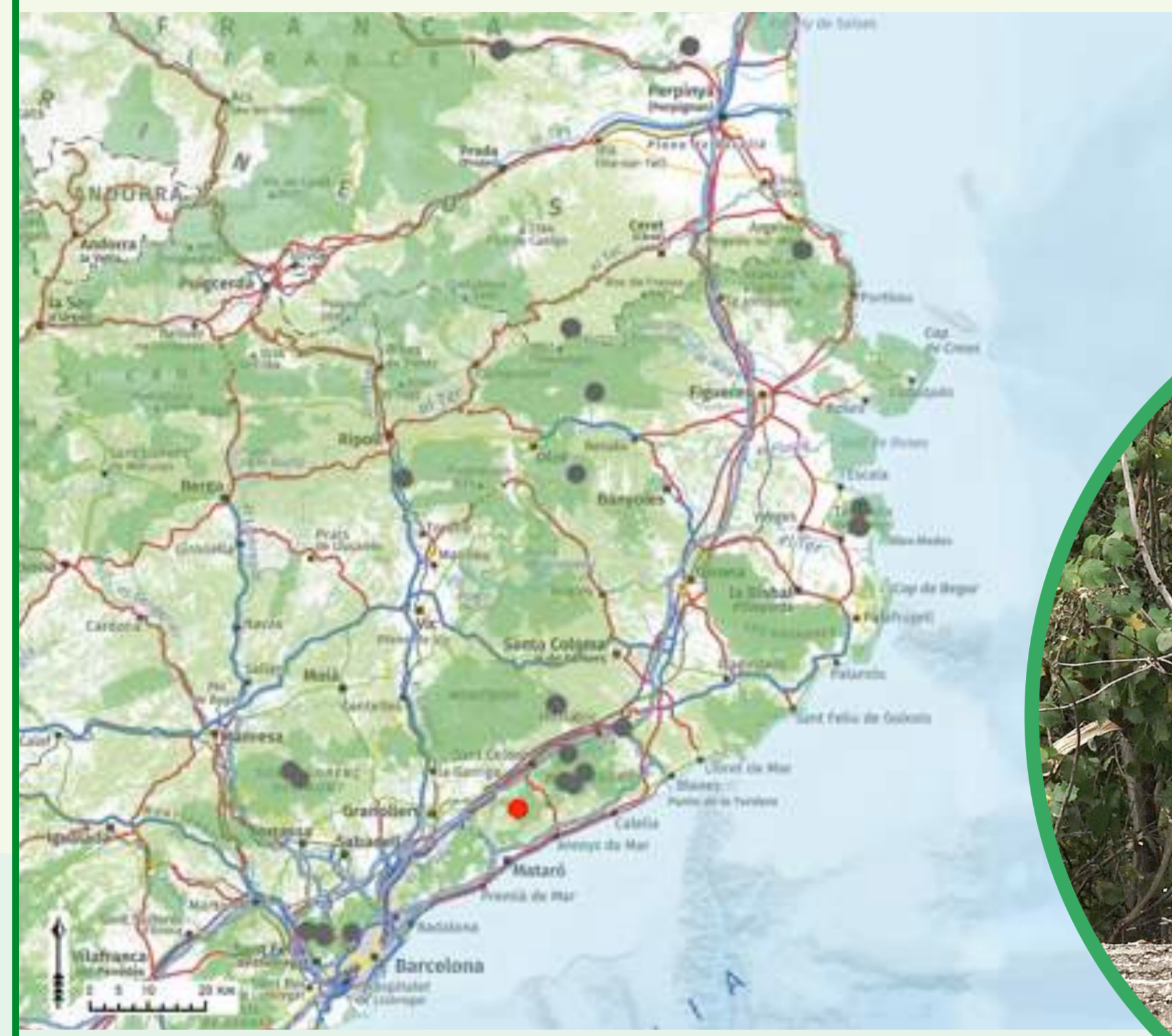
Localización del rodal demostrativo "Can Bosc" (rojo) i del resto de rodales del proyecto (gris) dentro de la Red Natura 2000.