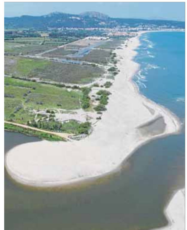
La gola del Ter, amb la zona de la Pletera

Ara, amb el Life Biorgest, un projecte menys ambiciós formalment que el Pletera, si bé amb un objectiu clar —la conservació del bosc mediterrani, sense defugir la voluntat de trobar la manera d'acordar gestió i conservació—, el municipi fa un pas més. Cal tenir present que l'Ajuntament de Torroella és el titular de la major part del bosc del massís del Montgrí, forest con-